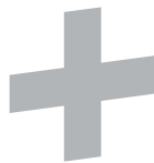
STROPNÍ NOSNÍKY RECTOR RS